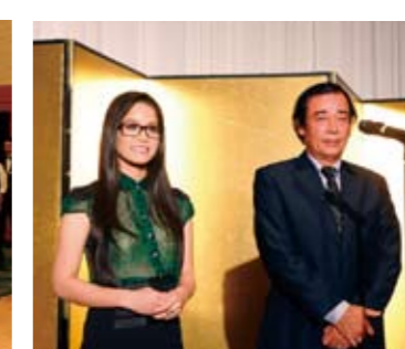
アジアフォーカスより参加