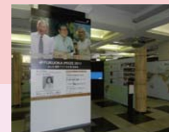
アジアマンスギャラリー(福岡市役所1階)