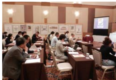
会場(受賞者作品のパネル展示)