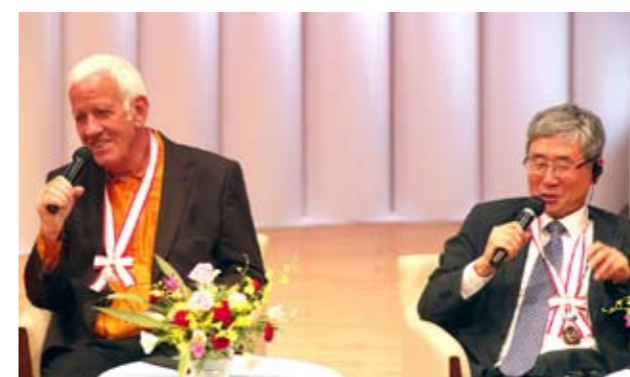
受賞者のトークに、会場は和やかな空気に包まれる