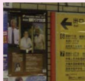
2011年ポスター(地下鉄駅構内)