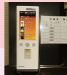
デジタルサイネージ