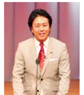
高島福岡市長による 主催者代表あいさつ