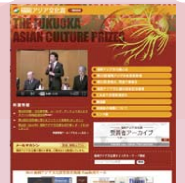
ホームページ(メルマガ会員募集中)