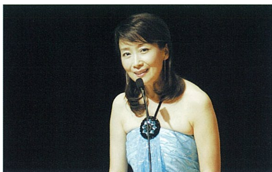
司会／アグネス・チャン氏 Master of Ceremony: Ms. Agnes Chan