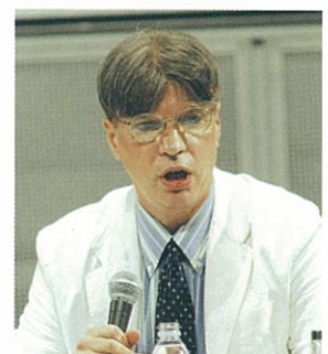
リービ 英雄氏 Professor Levy Hideo