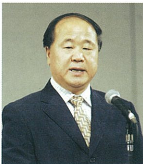
莫 言氏 Mr. Mo Yan