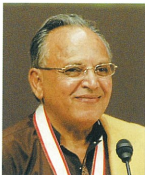
芸術・文化賞 アクシ・ムフティ

2006年(第17回)福岡アジア文化賞芸術・文化賞に、私を選んでくださった福岡市と財団法人よかトピア記念国際財団、そして福岡アジア文化賞委員会に心から感謝いたします。