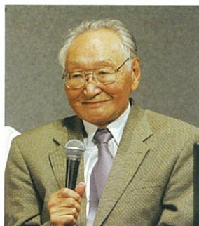
シャグダリン・ビラ氏 Professor Shagdaryn Bira

フォーラムの途中で、モンゴル出身の白鵬関からビラ氏へのお祝いメッセージのVTRを紹介。フォーラムの最後には、モンゴルで大人気の歌手グループ「カメルトン」が、力強くかつ透明感のある歌声を披露し、フォーラムを締めくくった。