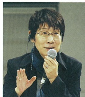
津島 佑子氏 Ms. Tsushima Yuko