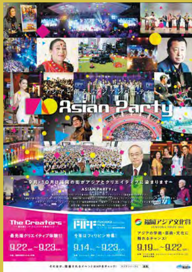
アジアパーティPRポスター

主要事業である「The Creators」、「アジアフォーカス・福岡国際映画祭」、「福岡アジア文化賞」の三つを柱に、民間企業・団体等と連携した様々なイベントを開催し、全18事業で約44万人に参加いただきました。