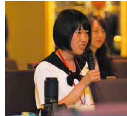
高校生記者からの質問