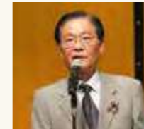
石田福岡市議会副議長による乾杯