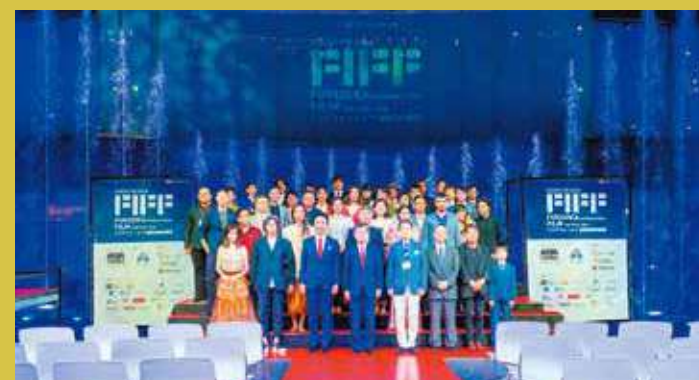
アジアフォーカス・福岡国際映画祭 2018.9.14 Fri-23 Sun