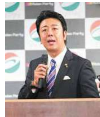
高島市長によるプレゼンテーション、福岡市の魅力をPR