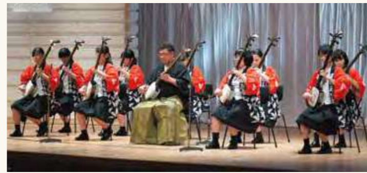
福岡大学附属若葉高等学校 津軽三味線部による祝賀演奏