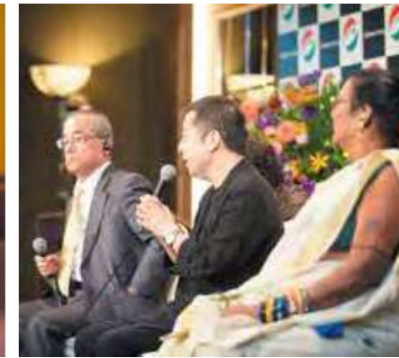
質問に答える受賞者