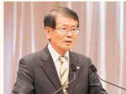
久保九州大学総長による選考経過の報告