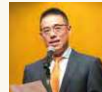
孫中華人民共和国駐福岡総領事館副総領事による来賓あいさつ