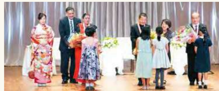
子どもたちと言葉を交わす受賞者