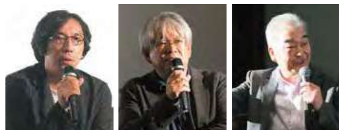
パネリスト 行定 勲 (映画監督)