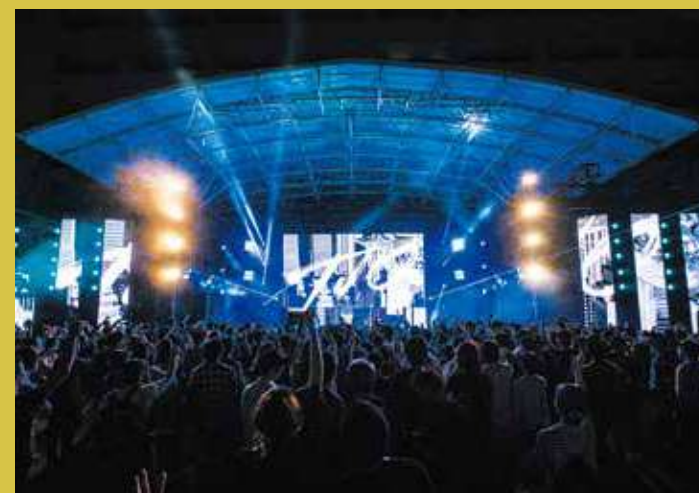
The Creators 2018.9.22 Sat-23 Sun