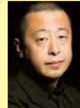
第29回大賞受賞者 賈樟柯