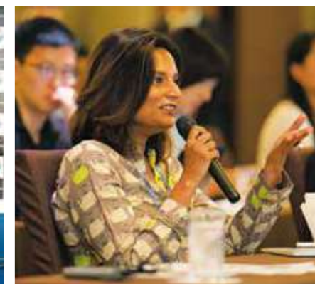
海外記者からの質問