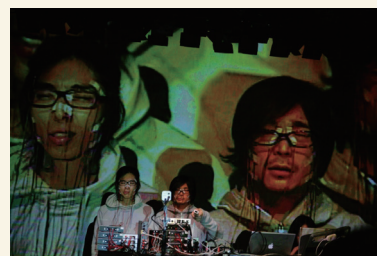
"Face visualizer, instrument, and copy"