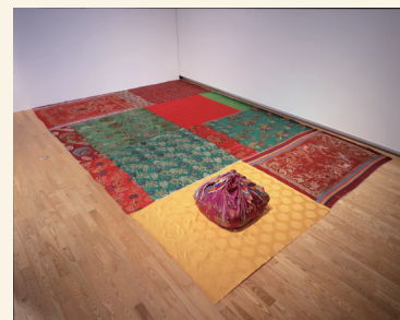
キムスージャ《演繹的オブジェ》 1997年 福岡アジア美術館所蔵

立体、映像、インスタレーションなどキムスージャの多様な作品には、縫う、包む、解く、といった概念が通底しているといいます。それは私たちの身体や呼吸にも関連するものです。韓国を起点にアジアの文化に触れ、現在は世界で活躍するキムスージャ。世界各地で分断や衝突が続く今日、彼女の作品を通して壮大な宇宙観や普遍的な真理について考えます。