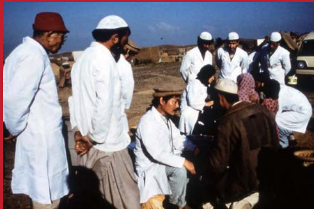
パキスタン・ベシヤワールにて難民の診療を開始/1989年

文化の振興と相互理解および平和に貢献するために創設された福岡アジア文化賞の精神を、30年にわたる活動で体現している中村哲氏は、まさに「福岡アジア文化賞一大賞」にふさわしい。