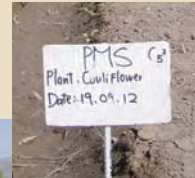
カリフラワー農場

乾いた大地に水が流れ、水辺には緑が生い茂ります。耕作ができるようになった土地には人々が戻り、畑が再建されました。そうしてひとつずつ、村が再建されています。