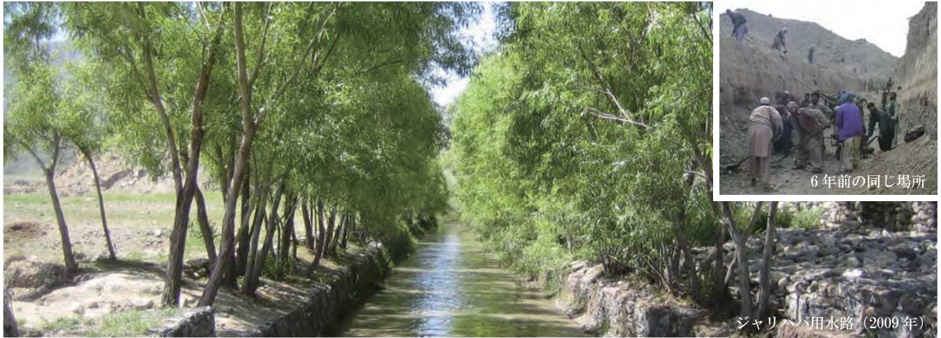
ジャリハバ用水路 (2009年)