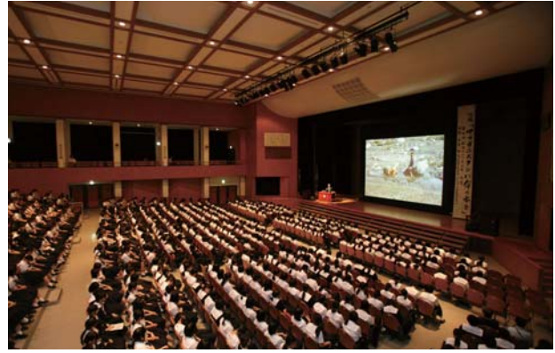
筑紫女学園中学・高校