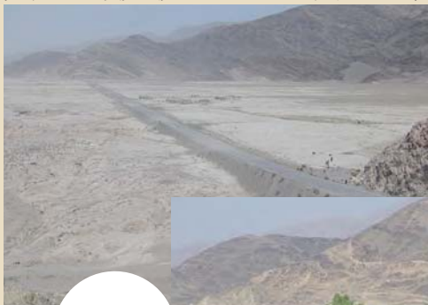
荒涼とした砂漠が続くスランプール平野 (2003年)

“クナール川流域に広がるスランプール盆地” ヤナギ、クワ、オリーブなどの緑が広がります