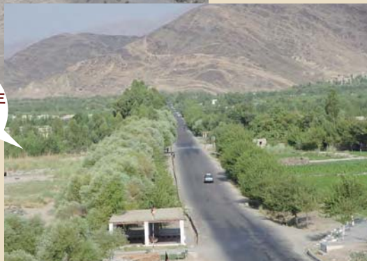
水が通り、緑が戻ったスランプール平野 (2012年)