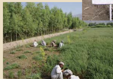
農作業する地元の農民たち